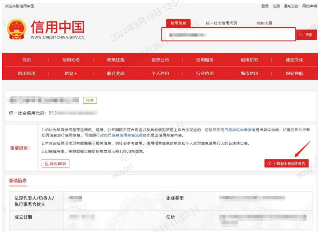
图 16 基本信息注册-信用中国查询

法人信用证明材料：输入 http://zxgk.court.gov.cn/ (中国信息执行公开网)，点击【综合查询被执行人】或者点击【失信被执行人】查询，然后点开输入身份证号姓名，然后将查询结果截图即可，详情参考图 17。