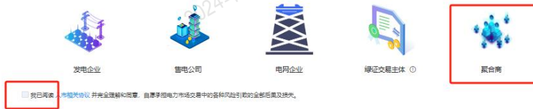
图 5 选择主体类型