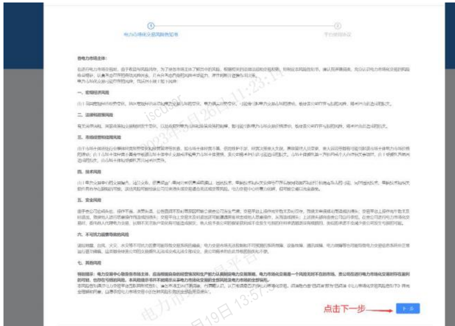
图 6 阅读入市相关协议